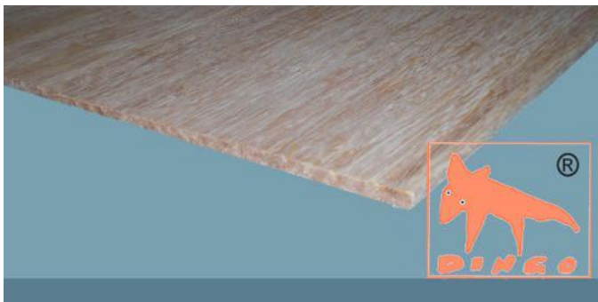
Honey – DURABAM D