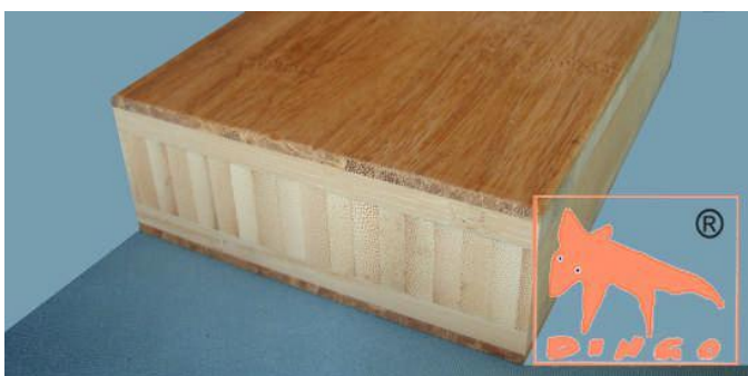
Honey - DURABAM DURABAM Deckschichten D 2440*1220*38 mm