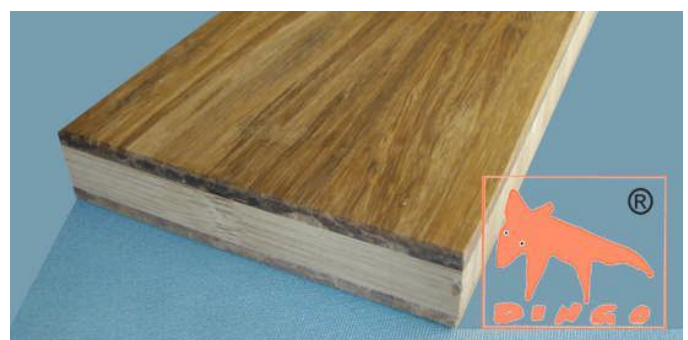
Marron - DURABAM DURABAM Deckschichten D 2440*1220*20 mm