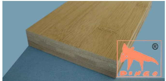
Kanu Braun - Horizontal Horizontal: klassische Optik HL 2440*1220*20 mm