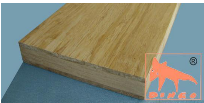
Honey - DURABAM DURABAM Deckschichten D 2440*1220*20 mm