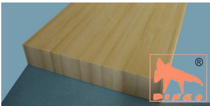
Bambus Natur - Vertikal