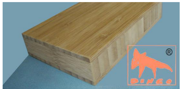
Kanu Braun - Vertikal Vertikal: moderne Optik (Fineline) V 2440*1220*16/20/25/30 mm