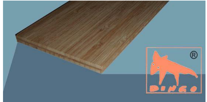
Kanu Braun - Vertikal Vertikal: moderne Optik (Fineline) V 2440*1220*7 mm