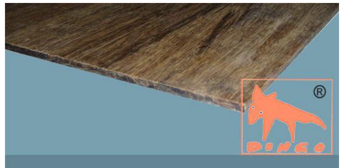
Marron – DURABAM D