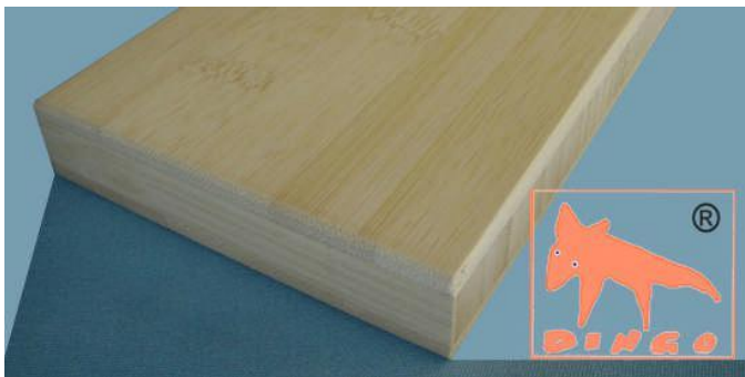
Bambus Natur - Horizontal Horizontal: klassische Optik H 2440*1220*16/20/25/30 mm