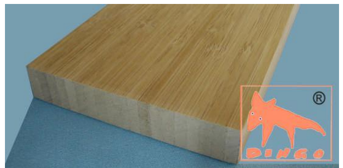
Kanu Braun - Vertikal