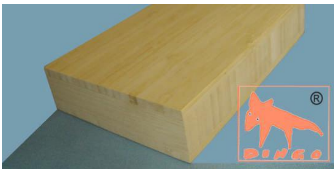
Bambus Natur - Vertikal Vertikal: moderne Optik (Fineline) V 2440*1220*16/20/25/30 mm