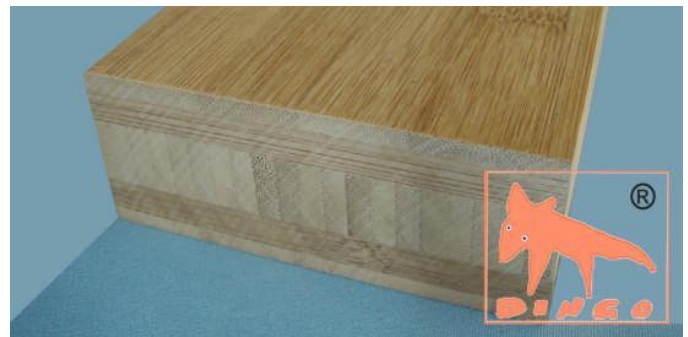
Kanu Braun - Horizontal Horizontal: klassische Optik H 2440*1220 / 3000*700 / 4000*620 / *40 mm