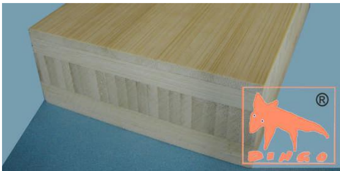
Bambus Natur - Horizontal Horizontal: klassische Optik H 2440*1220 / 3000*700 / 4000*620 / *40 mm