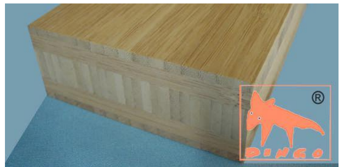
Kanu Braun - Vertikal Vertikal: moderne Optik (Fineline) V 2440*1220 / 3000*700 / 4000*620 / *40 mm