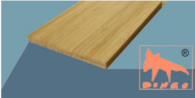
Bambus Natur - Vertikal Vertikal: moderne Optik (Fineline) V 2440*1220*7 mm