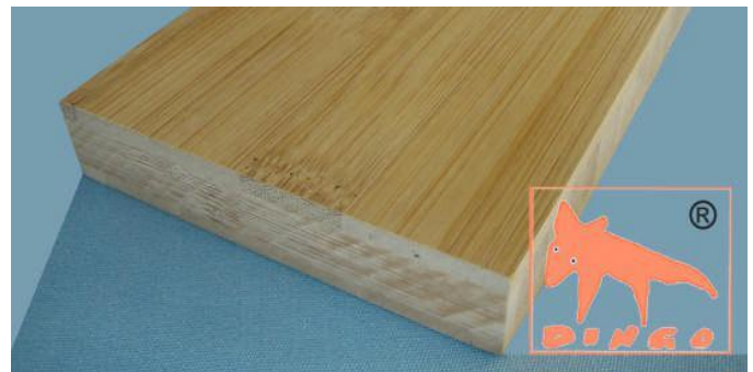
Kanu Braun - Horizontal Horizontal: klassische Optik H 2440*1220*16/20/25/30 mm