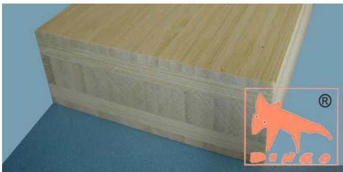
Bambus Natur - Vertikal Vertikal: moderne Optik (Fineline) V 2440*1220 / 3000*700 / 4000*620 / *40 mm