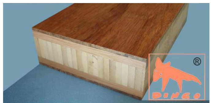
Marron - DURABAM DURABAM Deckschichten D 2440*1220*38 mm