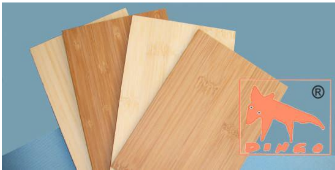
Bambus Natur und Kanu Braun